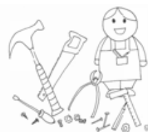
Maken van je eigen product

De school zal nooit aangifte bij de politie doen of proberen een ouder fysiek te benaderen. Wel zal school de andere ouder of voogd inlichten.